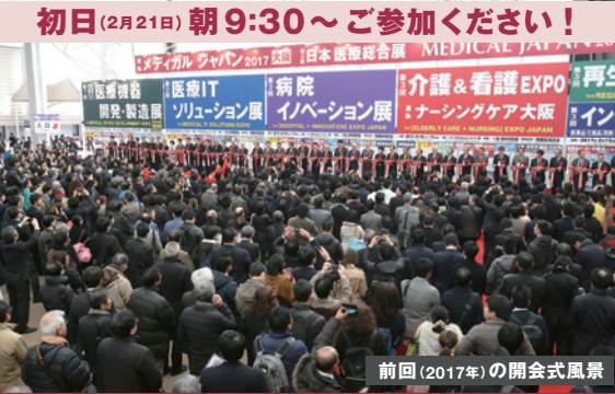
前回(2017年)の開会式風景